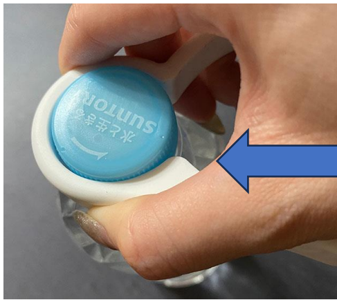
ボトルオープナー：少ない力で開けられます。100円ショップで販売