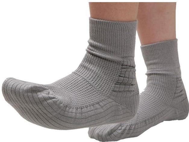
転倒予防靴下：自然につま先が上がります 介護ショップ・インターネットで販売

当センターでは作業療法士がその都度その方に合った便利グッズを紹介しています。今回はそのうちのいくつかを掲載しました。これらを使って頑張りすぎないことで気持ちにゆとりが生まれますね。インターネットや100円ショップで購入できます。