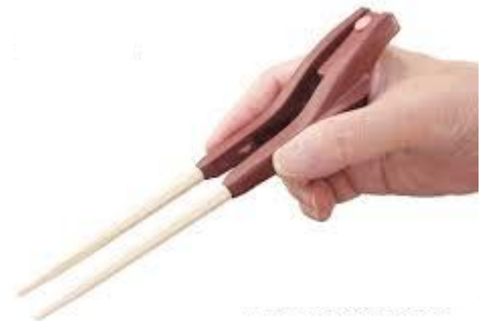
箸ゾウくん：つまみやすい箸 介護ショップ・インターネットで販売